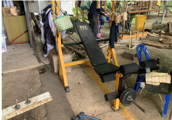
๗ เครื่องออกกำลังกายกล้ามเนื้อ